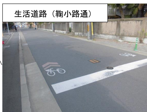
生活道路 (鞠小路通)