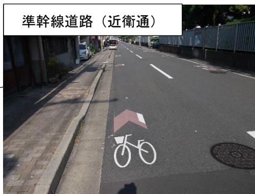
準幹線道路 (近衛通)