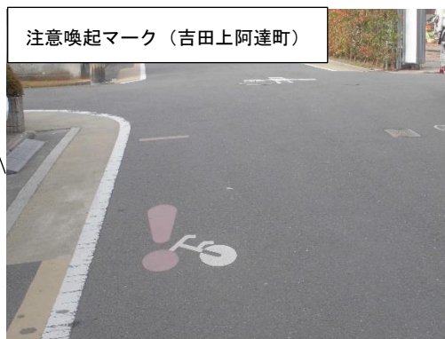
注意喚起マーク (吉田上阿達町)