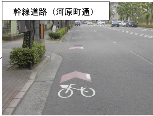
幹線道路 (河原町通)