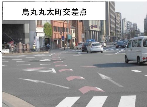
烏丸丸太町交差点